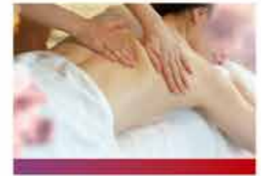
リラクゼーションセラピスト

スポーツを通じて、社会貢献やスポーツ振興に携わります。特にサッカーや水泳、バスケットボール、ダンスなどが人気です。