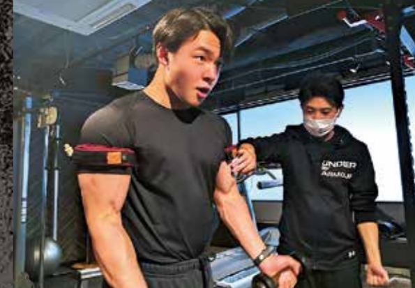
加圧トレーニング実習

スポーツ業界は幅が広く、多くの専門があります。それぞれ、その道のプロフェッショナルである先生から技術と知識を直接学べるため、視野が広がり就職の選択肢も増えていきます。