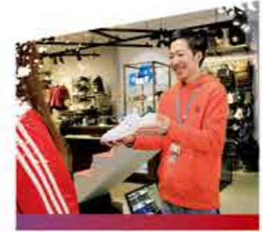
スポーツショップ スポーツメーカー関連会社

スポーツジムなどでトレーニング計画の作成や、マシンの使い方指導、メンテナンスなどを行います。