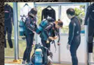
ダイビングライセンス講習