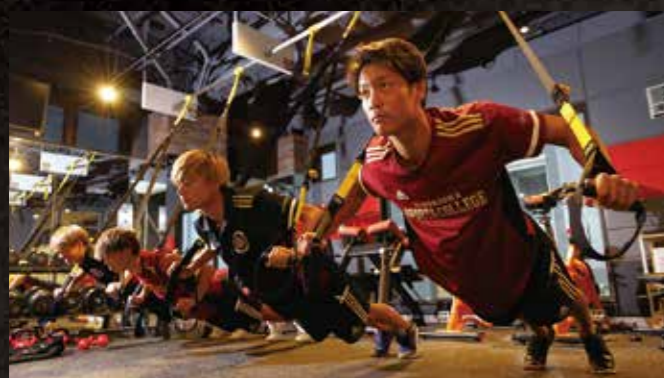
ファンクショナルトレーニング

トレーニングジムに、アジア人の骨格に合わせて設計されたKONGOU社の最新マシンを導入。大人の雰囲気漂うブルックリンスタイルの本格的なトレーニングジム&スタジオで、プロの世界に近づこう！