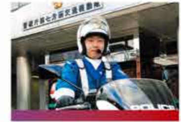
警察官・消防官・自衛官

主にサロンで、お客様の心身を癒す整体やボディケア、リンパケアなどの施術を行います。