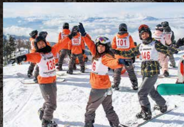
スノーボード実習