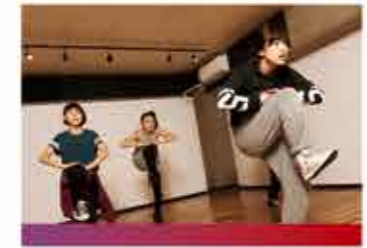
ダンスインストラクター

最高のトレーニングを提供するために大切なのは、観察力とホスピタリティです。トレーナーは接客業ですから、一流のサービス精神がお客様との信頼関係を築くことにつながります。コミュニケーションが大切だという意識をもって、トレーニングを学んでほしいと思います。