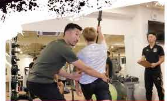
活躍する立志舎の卒業生