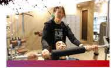
パーソナルトレーナー

お客様とコミュニケーションを取りながら、一人ひとりにあったプログラムを提案します。