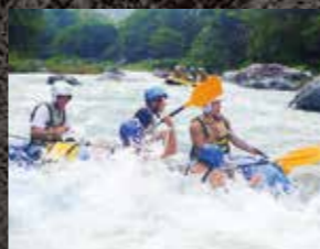
ラフティング実習