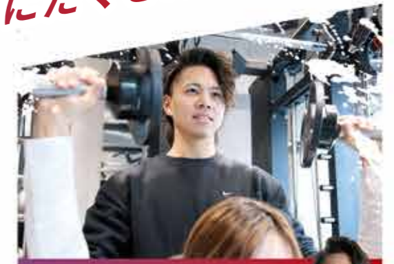
活躍する立志舎の卒業生

お客様の目的やスキル、好みにあわせてスポーツ用品選びをサポートします。スポーツ用品の開発などを行います。