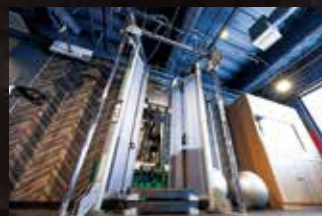
デュアルアジャスタブルプーリー