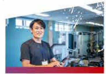
フィットネスインストラクター フィットネストレーナー

幼稚園から小学校低学年までの幼児・児童を対象に、健全育成を目的として、スポーツの素晴らしさを伝えます。