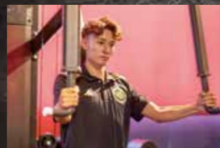
ペクトラルフライ